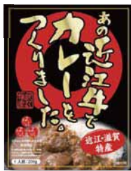
■ 近江牛カレー (あの近江牛でカレーを作りました。) 895円

皮にも餡にもよもぎを練り込んだ香り豊かな素朴な味のまんじゅうです。永源寺の里で収穫されたよもぎを使用しています。