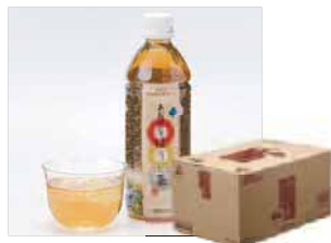
■ あおばなほうじ茶 1本 150円

日本三大和牛の一つ滋賀特産「近江牛」のとろけるおいしさを気軽にご家庭でお楽しみいただけます。