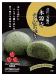
■ 永源寺まんじゅう 735円

豆腐大豆に近江・滋賀県産大豆100%使用。スポンジ生地に近江・滋賀県産コシヒカリ超微粒子米粉100%使用。