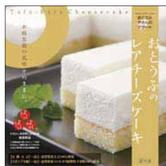
■ おとうふのレアチーズケーキ 1,575円

国産茶葉100%使用。400年にわたり栽培される「草津あおばな」と1200年の歴史を誇る信楽朝宮緑茶を絶妙にブレンド。