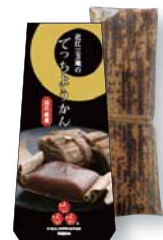
■ でっちゃんかん 370円

国産茶葉100%使用。400年にわたり栽培される草津あおばなと1200年の歴史を誇る信楽朝宮のほうじ茶を絶妙にブレンドしました。